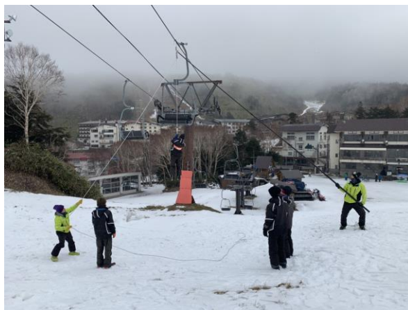
職員による緊急時の対応訓練状況