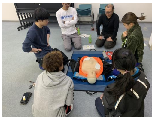
志賀高原統一新人研修会