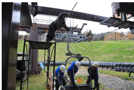
第2ペアリフト握索機整備状況