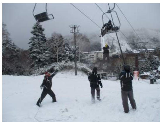
職員による緊急時の対応訓練状況