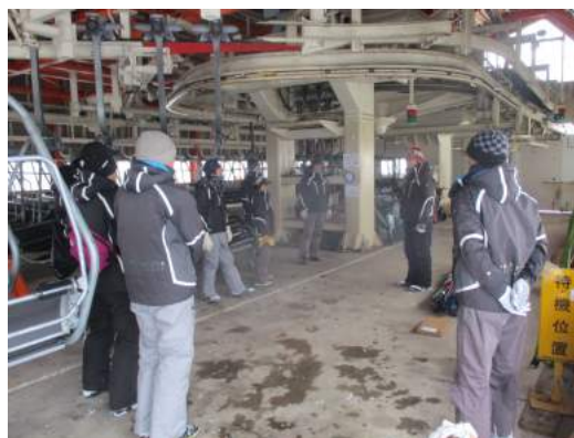
索道取り扱い研修