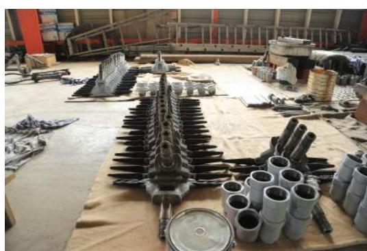
第3クワッド及び第2ペアリフト握索機整備状況