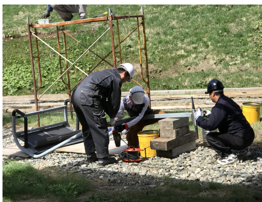
第2ペアリフト握索機整備状況