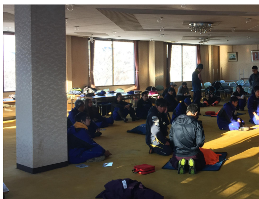
志賀高原新人研修会

当社では、輸送や皆様の安全に役立つよう、施設及び取扱についての安全教育を実施しています。