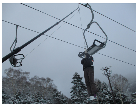
職員による緊急時の対応訓練状況