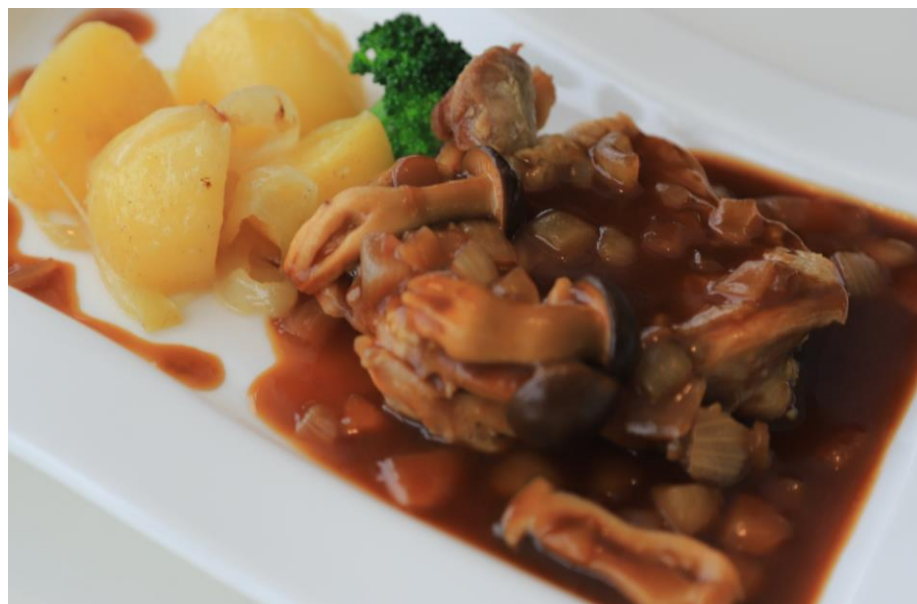
チキンソテーセット ¥1400