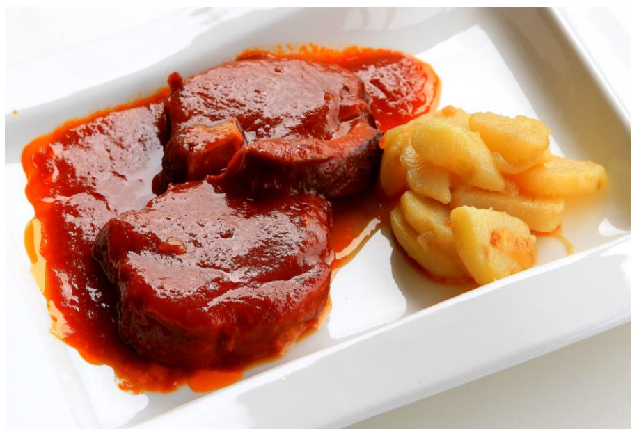
ポーク煮込みセット ¥1400