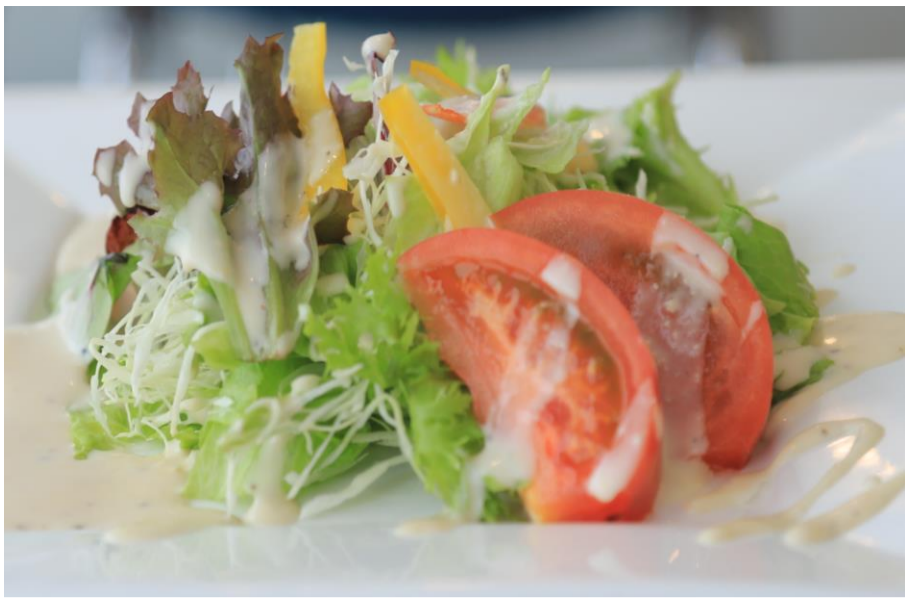
ベルドールサラダ ¥700