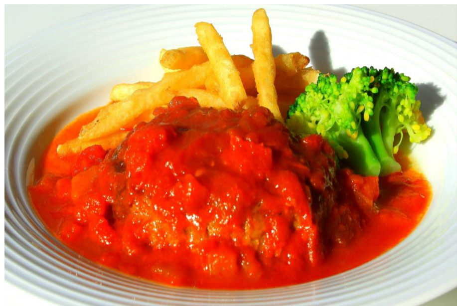
ハンバーグセット ¥1200