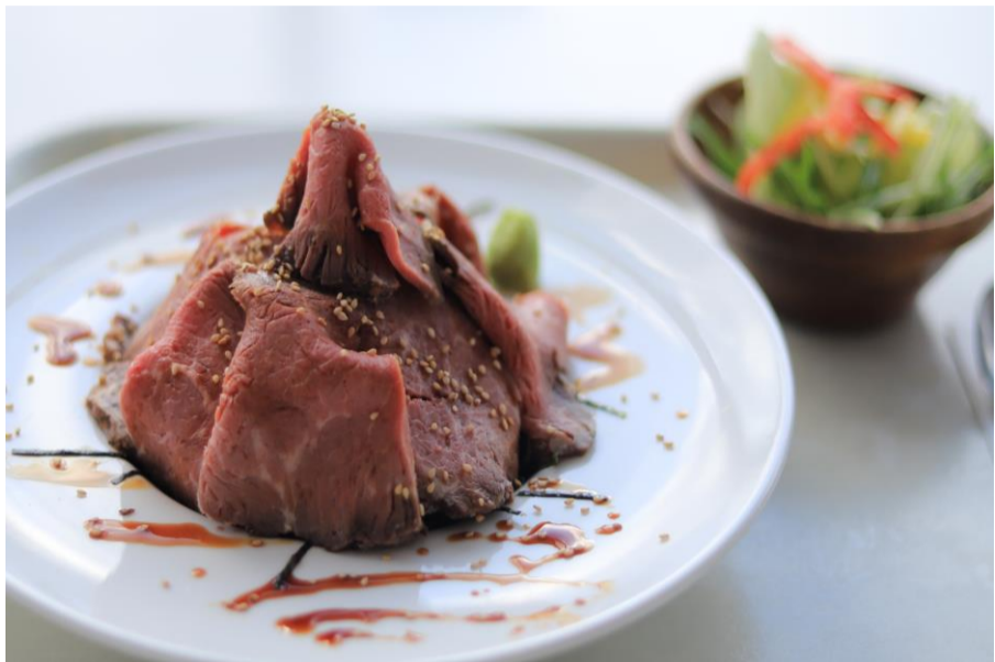
ローストビーフ丼 ¥1600